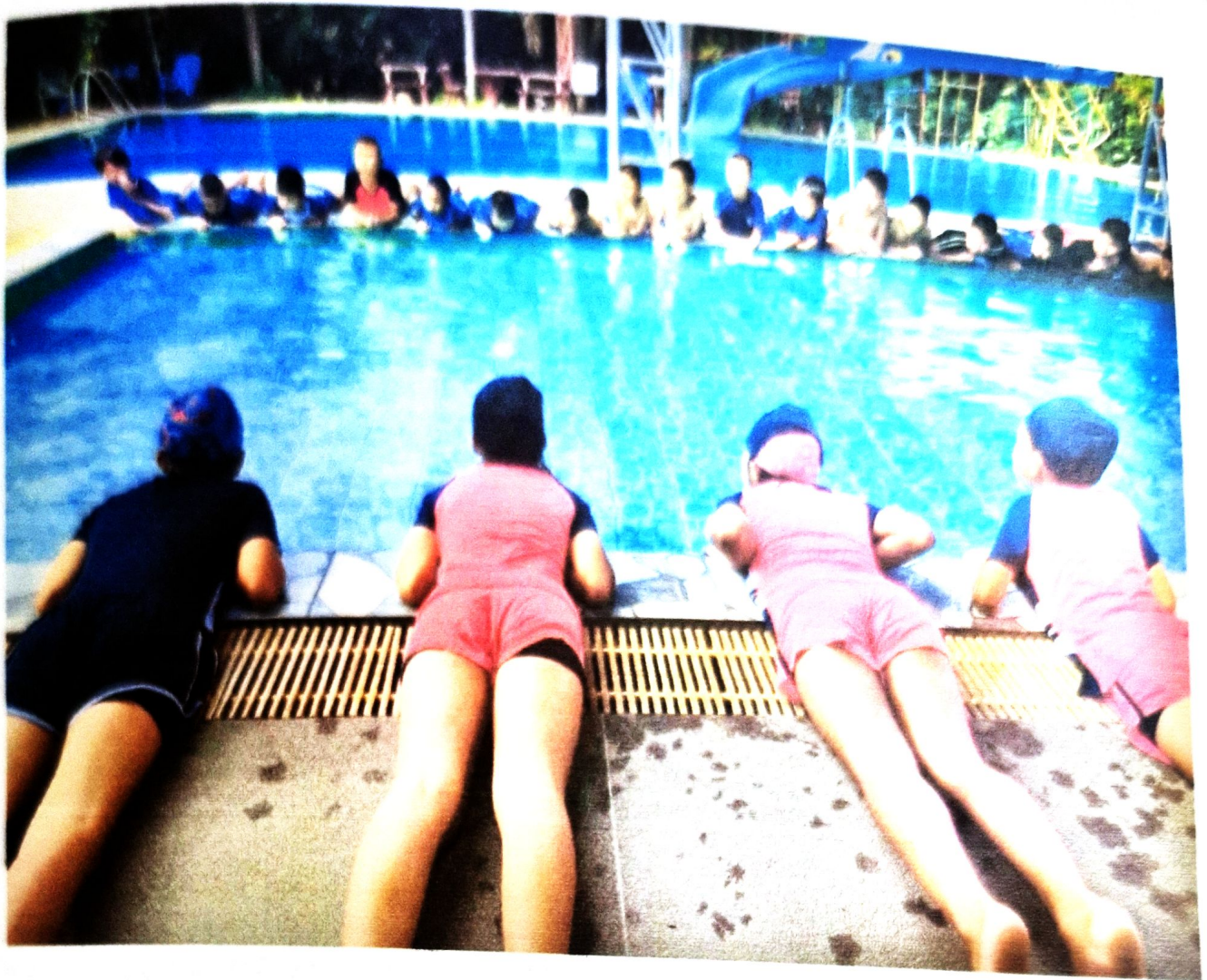
นักเรียนเรียนทักษะพื้นฐานก่อนลงสระว่ายน้ำ