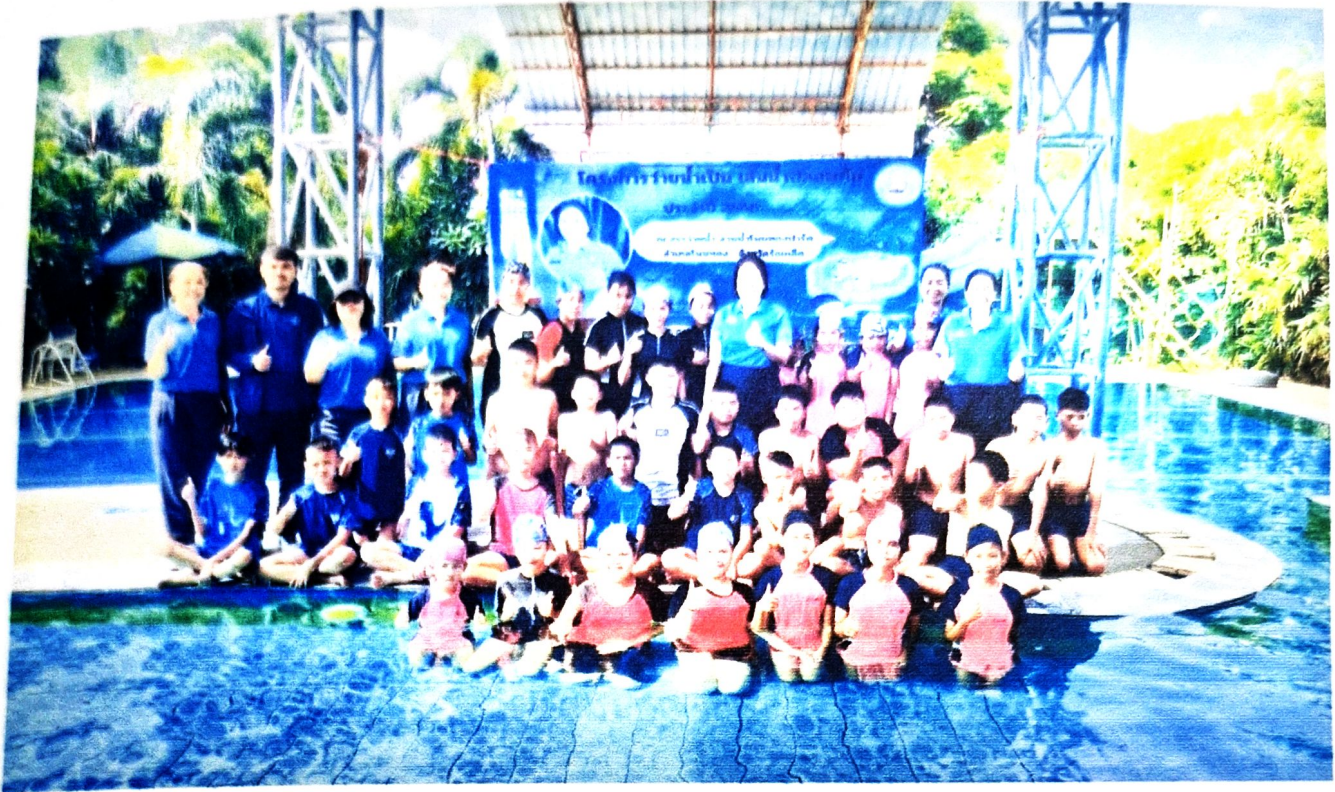
นักเรียนฟังบรรยายก่อนลงสระว่ายน้ำ