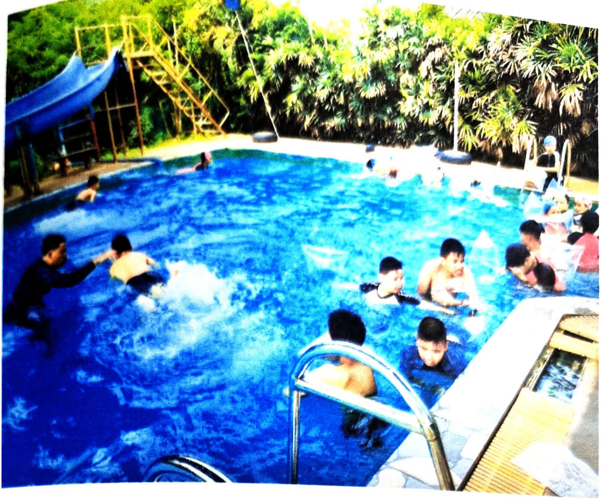
นักเรียนทำการสอบท่าต่างๆในการว่ายน้ำ